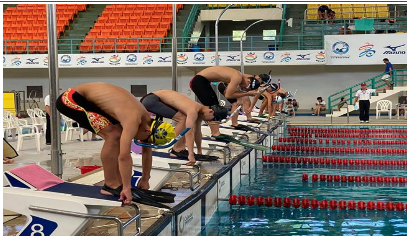
水面蹼泳比賽項目