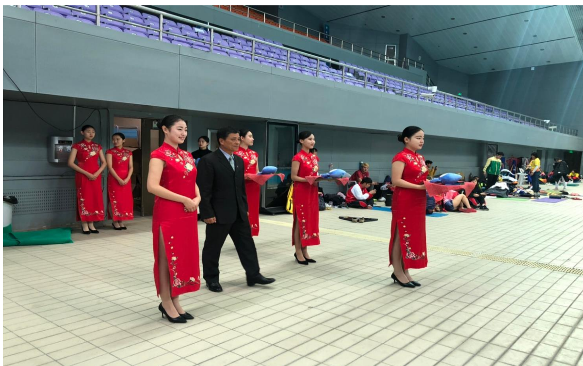
曾理事長上台頒獎