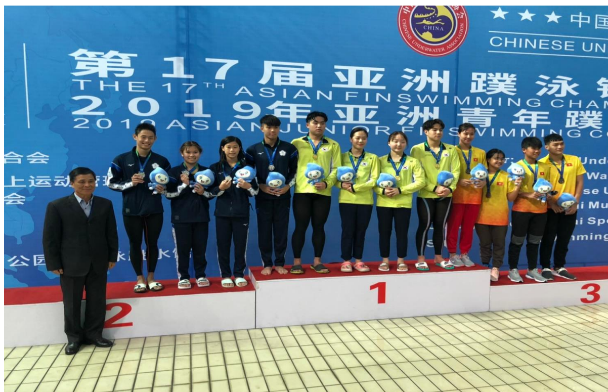
曾理事長上台頒獎與選手合影