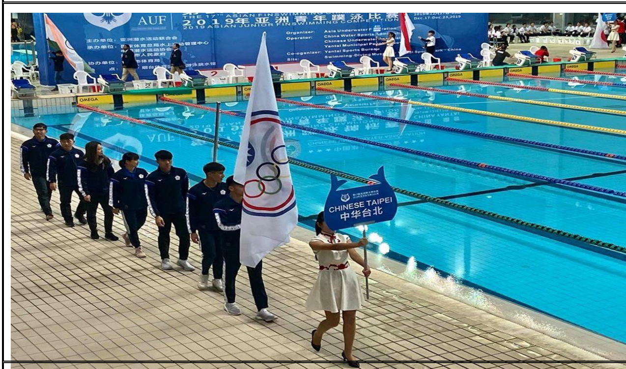
開幕典禮，選手進場