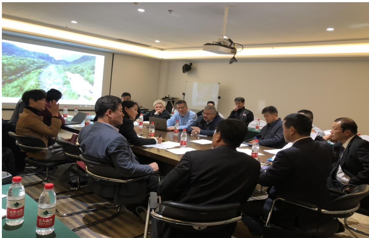
亞洲水中聯盟會議