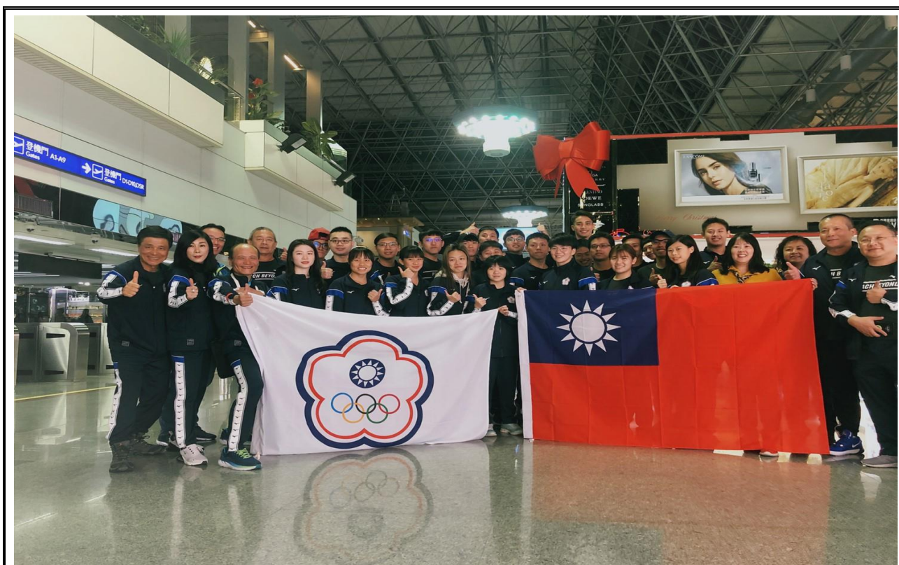
出發前機場大合照