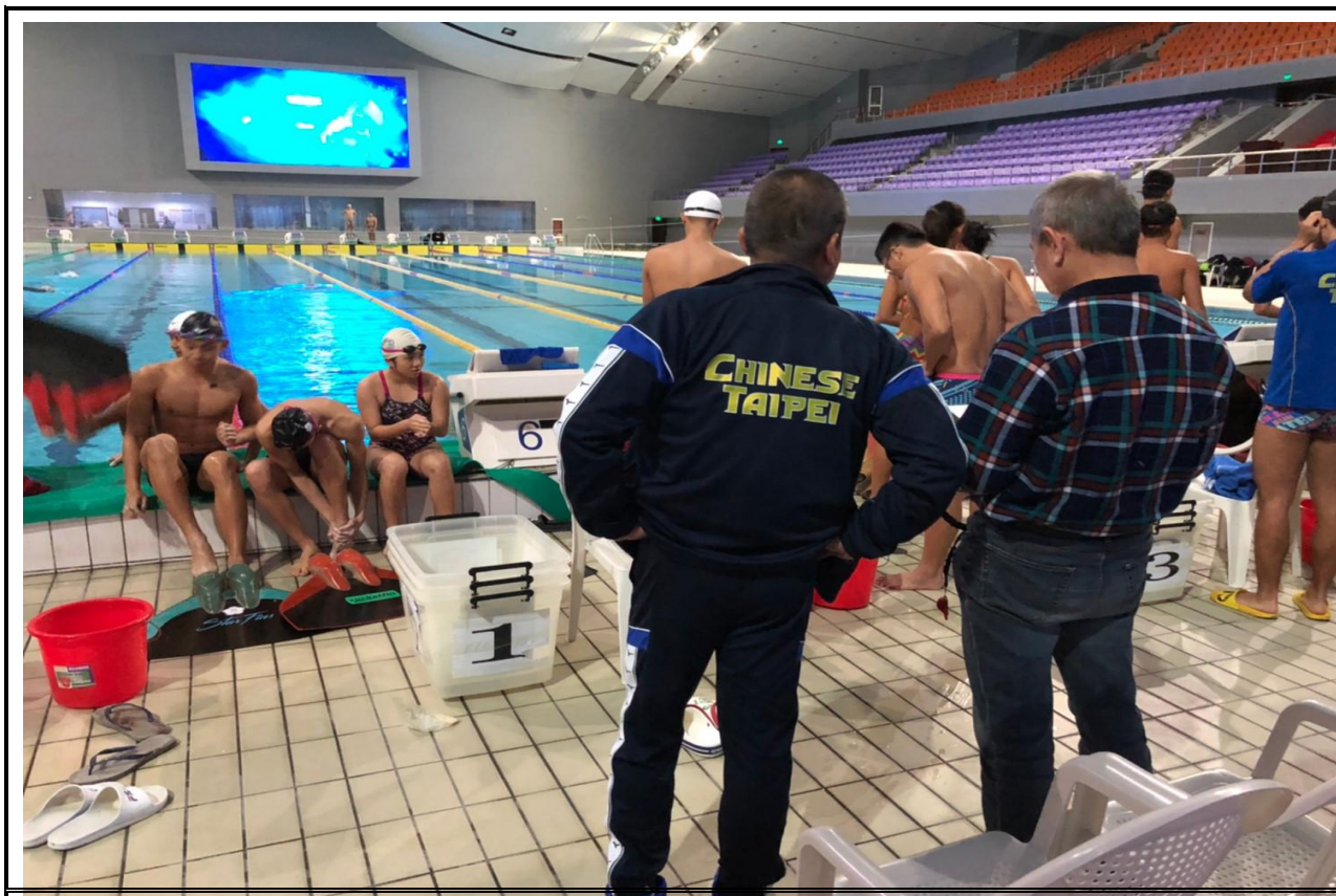
教練指導選手練習