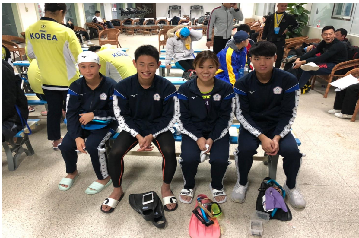
中華台北隊-接力檢錄