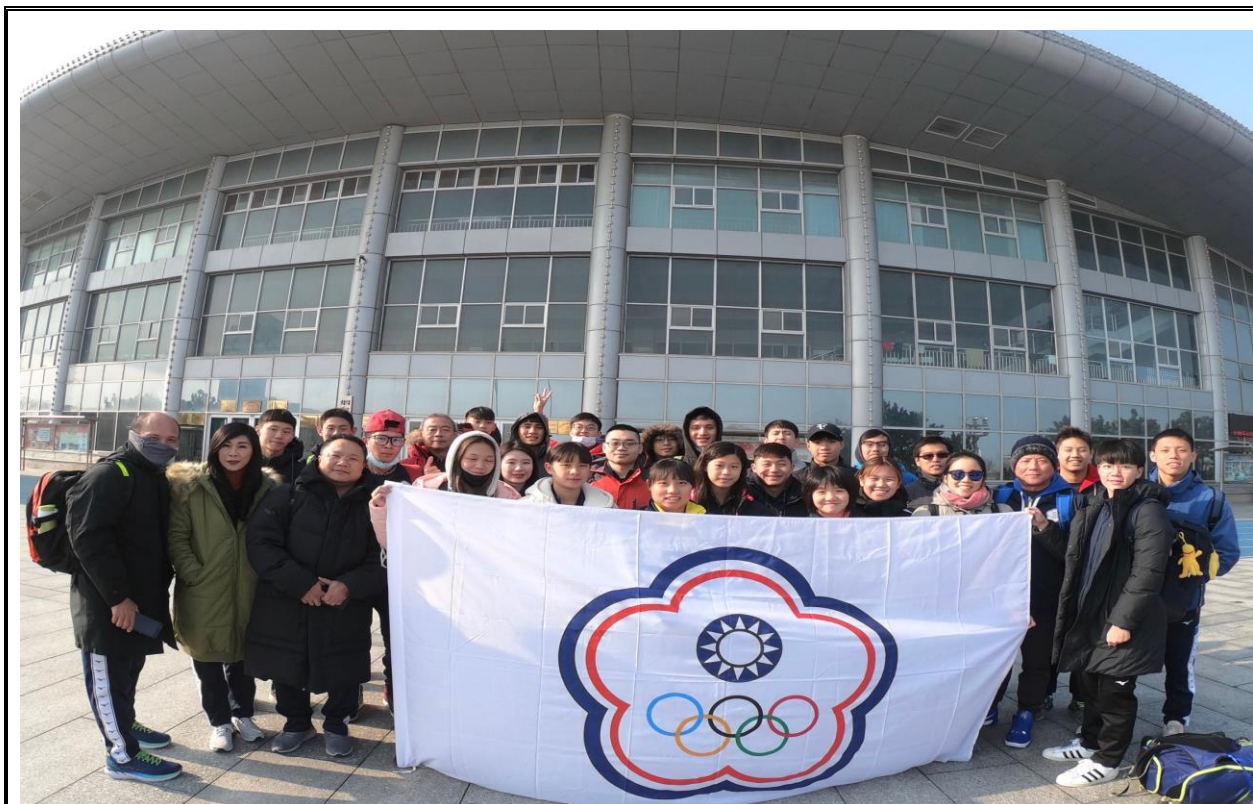
游泳館外合影合影